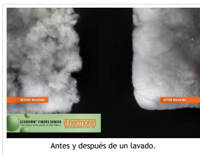
Antes y después de un lavado.

La compañía Thermore presentó la fibra aislante Ecodown Fibers Genius, a la que considera “un paso adelante en materia de fibras libres”. Describe que “el uso de Ecodown Fibers Genius en una prenda permite que las fibras se entrelacen, creando así una uniforme y estable capa de aislamiento.”